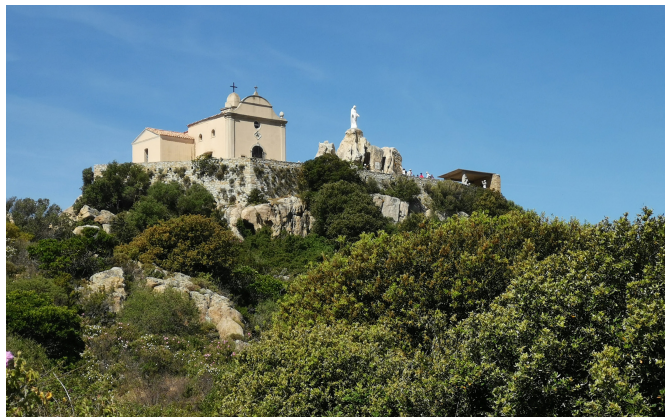
Page 4 de 7 - Copyright Europe Active - 16 Avril 2026